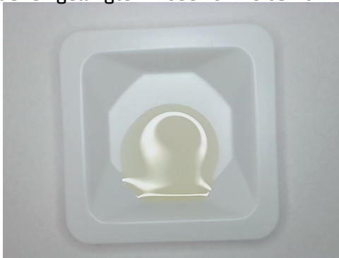
Bild der eingelangten Probe vom 16.09.2022