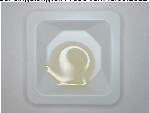
Bild der eingelangten Probe vom 16.09.2022